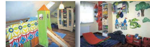
Fotos unten: Die Kinderzimmer, Bad, der Essbereich, die Küche und das Arbeitszimmer.

Hohe Stauden und asiatische anmutende Gestaltungsaccessoires wie kleine Steinbrücken und Miniaturpagoden setzen weitere attraktive Akzente.