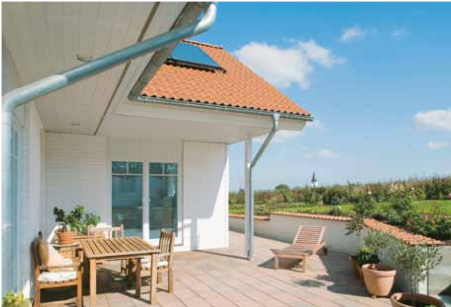
Ein bisschen skandinavisches Hausflair, ein wenig mediterrane Gemütlichkeit: Auf der mit zahlreichen Kübelpflanzen geschmückten Terrasse mit unverbautem Blick auf das Siebengebirge verbringen Maresa und Dirk Sommer viele gemeinsame Stunden.